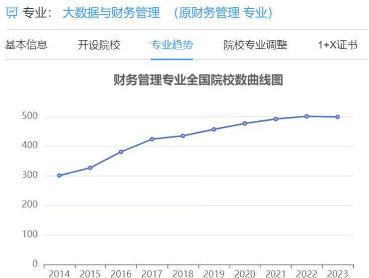
图 1-大数据与财务管理专业开设院校数量